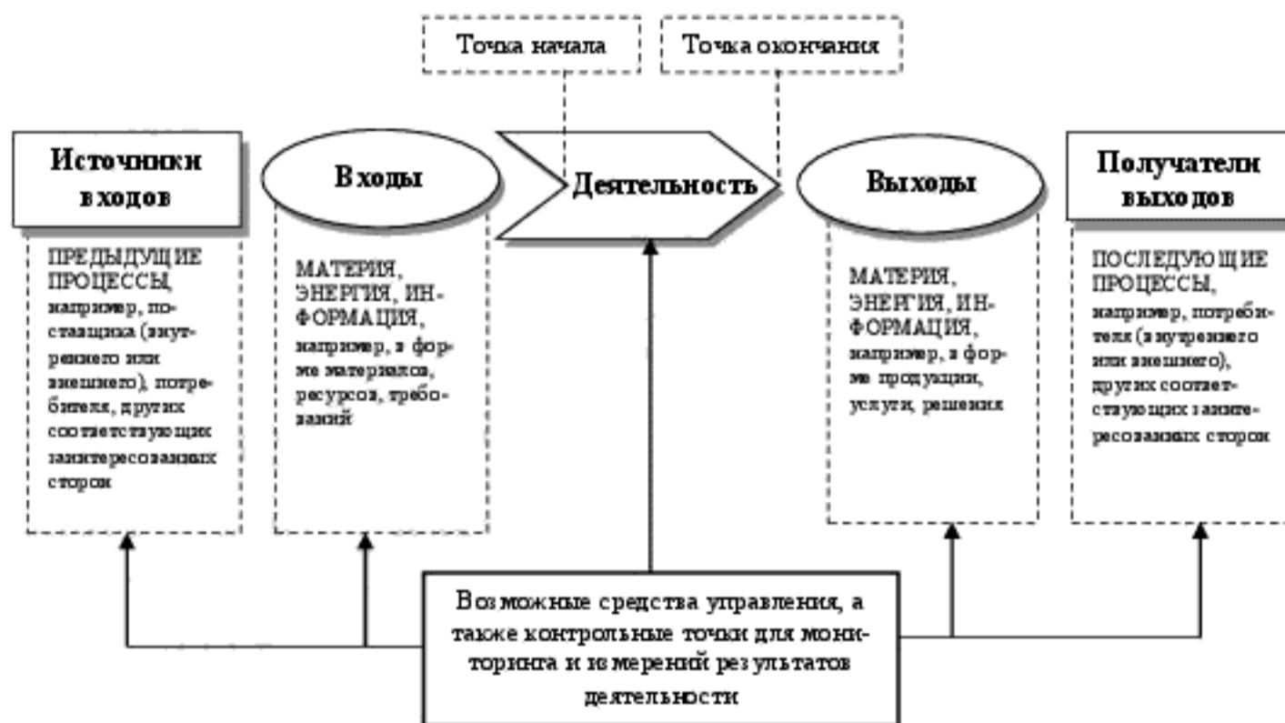
Рисунок 1 — Схематичное изображение элементов процесса

Рисунок 1 дает схематичное изображение любого процесса и иллюстрирует взаимосвязь элементов процесса. Контрольные точки мониторинга и измерения, необходимые для управления, являются специфическими для каждого процесса и будут варьироваться в зависимости от соответствующих рисков.